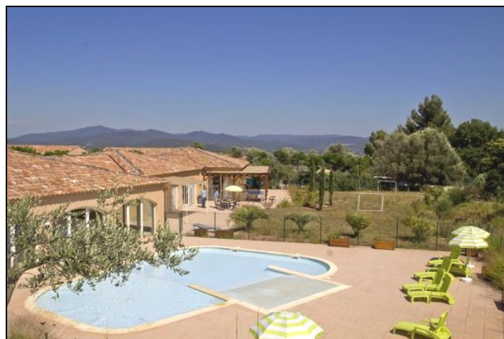
Village vacances Lou Bastidou

Les alentours directs du Bastidou incitent à la promenade en campagne. Cuers, situé à 3 kms, est typique avec son cœur de village à visiter jusqu'à la chapelle et pratique pour ses restaurants, ses magasins et supermarchés, son marché paysan tous les vendredi matin.