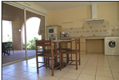
Cuisine/séjour et terrasse d'un gîte

Nous proposons, pour les familles, 6 gîtes de 65 m 2 accueillant jusqu'à 5 personnes, avec une cuisine séjour entièrement équipée (plaque de cuisson, four électrique, four à micro-ondes, frigo-congélateur, lave-vaisselle et lave-linge, télévision, accès Wifi) et accessible aux personnes à mobilité réduite, une salle de bain avec douche à l'italienne, des toilettes avec barre d'appui, 1 chambre double et 1 chambre avec 1 lit simple (médicalisé) et 2 lits superposés, une terrasse couverte sous pergola avec son salon de jardin.