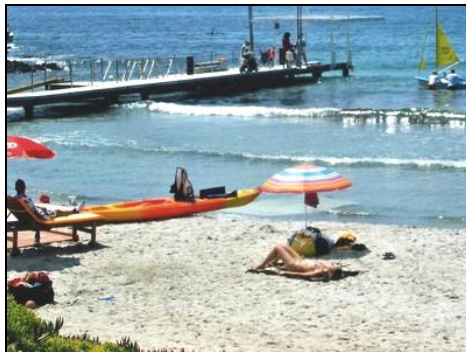
Ponton aménagé Pierre Caron, Association Un fauteuil à la mer à Giens

Nous avons répertorié un grand nombre d'adresses d'activités accessibles aux personnes à mobilité réduite que nous tenons à disposition à l'accueil et sur notre site internet. Nous pouvons proposer des sorties, promenades, activités sportives et de loisirs, musées, plages, restaurants, accessibles et accueillants !